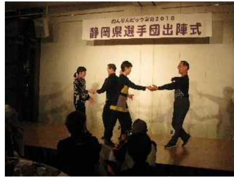
ねんりんピック富山2018体験談その2

選手の交流が行われる最中、太極拳選手団が太極拳を披露(写真左)し、ダンス種目参加選手はダンスを披露しました(写真右)。