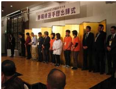
ねんりんピック富山2018体験談その2