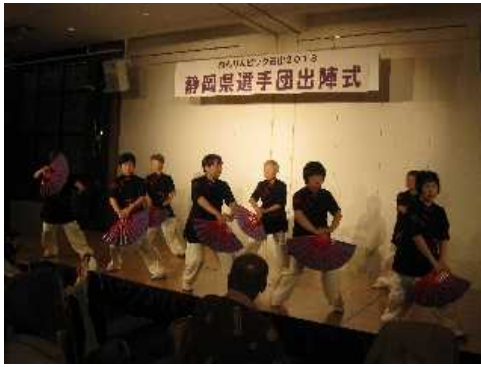
ねんりんピック富山2018体験談その2