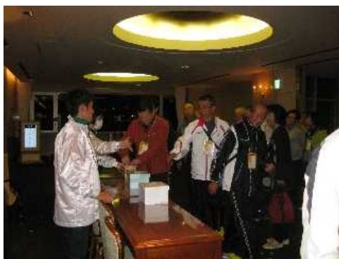
ねんりんピック富山2018体験談その2