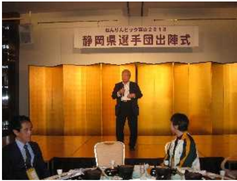
ねんりんピック富山2018体験談その2

ねんりんピック富山2018開会式を明日に控えた平成30年11月2日(金)夕、選手団の宿泊ホテルに於いて出陣式が行われました。写真は開会の挨拶をする佐古伊康しずおか健康長寿財団理事長。